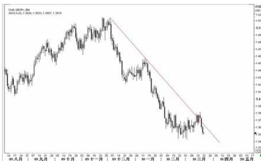
图6：欧元日K线图（截至北京时间10年3月22日）

短期来看，欧元很快将会测试前期低点 1.3430，若该支撑失守，则标志着欧元打开新的下行空间，届时将有跌向 1.31 一线的风险，可考虑逢高做空，否则应继续观望。