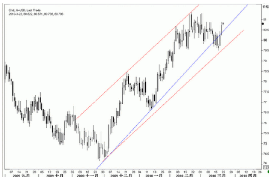
图4：美指日K线图（截至北京时间10年3月22日）