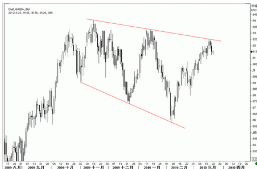
图9：澳元日K线图（截至北京时间10年3月22日）

澳元上周冲高回落，在喇叭口形态的上轨压力处遭遇卖盘打压，已经跌破了2月底开始的短期上升趋势线，表现出轻微的触顶信号，预计短期有望进一步测试2月初开始的上升趋势线，当前该支撑在0.9070。若我们对喇叭口形态的判断正确，则澳元后市将面临大幅下行的风险。