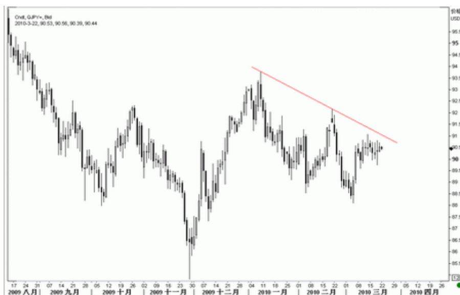
图8：美元/日元日K线图（截至北京时间10年3月22日）