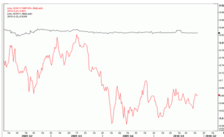
图5：人民币即期汇率（黑）与1年期NDF汇率（红）

近期中美之间围绕人民币汇率的争执已经进入白热化阶段，双方矛盾不断升级，并有向贸易领域发展的风险。对于人民币汇率的看法，各位投资者可阅读我们上周推出的专题报告《人民币汇率中期前景及升值的潜在影响》一文。