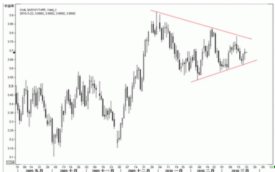
图3：10年期美债收益率日K线（截至北京时间10年3月22日）

10 年期美债收益率上周触底反弹，继续在我们判断的三角形形态中运行，当前上方阻力位于 3.80%。通常而言，三角形属于持续形态，后市该收益率上行的几率较大，这也符合当前美债基本面形势。目前该收益率已在三角形内完成五波运动，若我们的判断正确，该收益率近期将有向上突破的机会，目标可上看 4.0% 甚至更高。