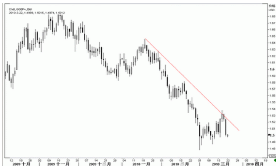
图7：英镑日K线图（截至北京时间10年3月22日）

预计英镑近期走势仍会疲弱，有下探前期低点 1.4780 的可能，若该支撑失守，将跌向双顶目标位 1.46 甚至更低。