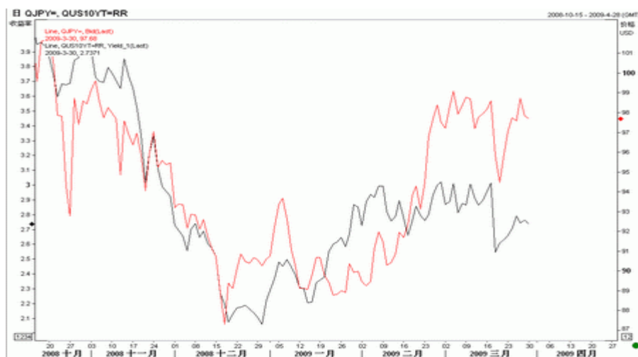
图6：美元/日元与10年期美债收益率（截至北京09年3月30日）

美元/日元上周继续追随美债收益率走势，上行趋势明显，但美元/日元的上行速度较美债更快。预计如果美债收益率维持上行