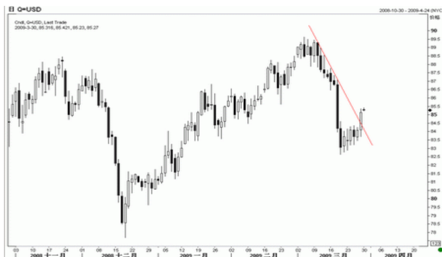
图1：美元指数日K线图（截至北京时间09年3月30日）

从技术图表观察，美元指数上周尾段强劲反弹，升破了3月初以来的下降压力线，发出了跌势放缓的初步信号，具备进一步反弹的条件。不过，短线来看，美指是否已经触及阶段底部仍有较大不确定性，近期走势可能较为反复。中长期而言，我们维持看涨美元的观点不变。