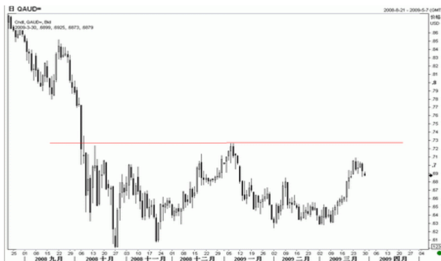
图7：澳元日K线图（截至北京09年3月30日）

美元/加元上周触及支撑后出现反弹，尽管日图 KD 指标并不支持汇价上行，但从技术图表观察，美元/加元似乎在运行一个更大型的整理三角形，当前下轨支撑在 1.2140，在此价位之上，可维持看涨。