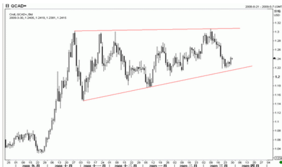
图8：美元/加元日K线图（截至美东09年3月30日）