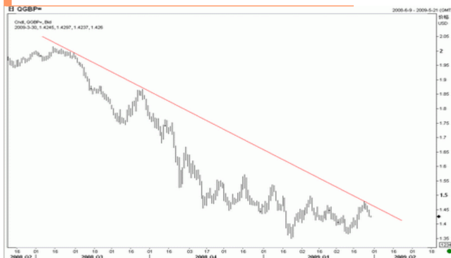
图5：英镑日K线图（截至北京09年3月30日）

英镑上周冲高后触及长期下降压力线，测试不过明显回落，这样，英镑的长期下行趋势仍在持续，短期缺乏进一步反弹的机会。预计汇价继续下行的风险很大，有跌向 1.3660 甚至更低价位的风险。