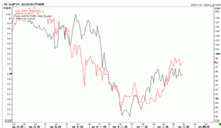
图7 :美元/日元与10年期美债收益率(截至北京09年3月16日)

目前市场在关注日本央行的态度，特别是在瑞士央行意外干预汇率之后。日本出口严重受到了此轮经济危机的影响，出口几近腰斩，由于在过去十几年经济停滞期，出口是日本经济增长的重要推动力，因此出口的大幅下滑对日本经济构成重大挑战。