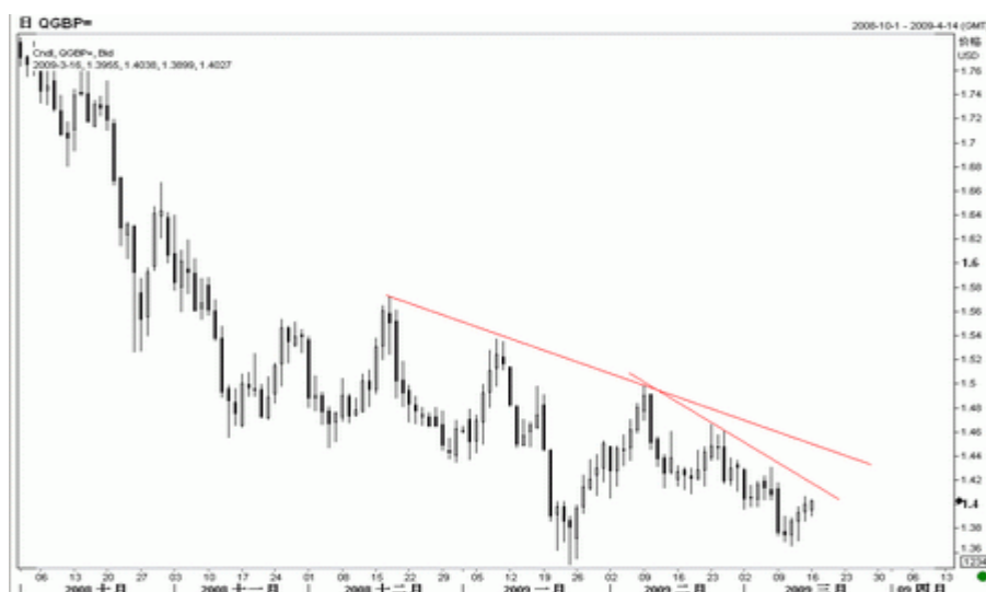
图6：英镑日K线图（截至北京09年3月16日）

从技术图表观察，英镑上周出现触底反弹，短线保持反弹势头，但走势较欧元脆弱许多，因其目前尚未突破任何一个有实质意义的阻力位，自去年 12 月开始的一条下降压力线依然压制汇价，而更上方还有一条长期下降压力趋势线。预计英镑在上述阻力位前走势