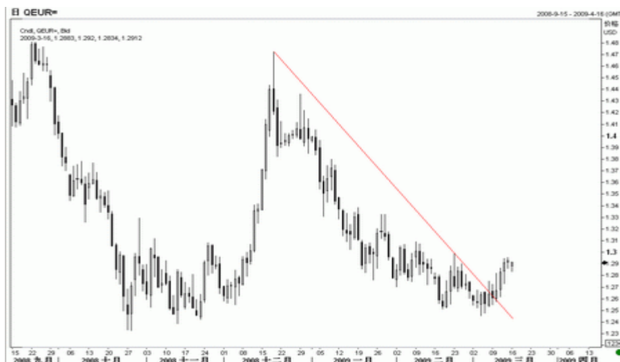
图5：欧元日K线图（截至北京时间09年3月16日）

上周欧元区公布了一系列令人沮丧的数据，显示经济危机对欧洲实体经济的打击已经超出了预期，但得益于技术上的突破，欧元表现仍抢眼。