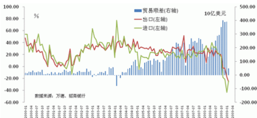
图3：中国进出口形势

与周边出口竞争对手相比，我们发现，亚洲其他国家的出口数据几乎与中国同步大幅恶化，表明全球需求萎缩对出口国家同时造成了打击，但这些国家的最新数据已经表现出跌幅放缓的迹象，唯有中国数据在继续向下探底。我们认为，尽管全球需求呈现萎缩局面，但汇率变化通过价格链条的传导机制，仍会对出口带来明显影