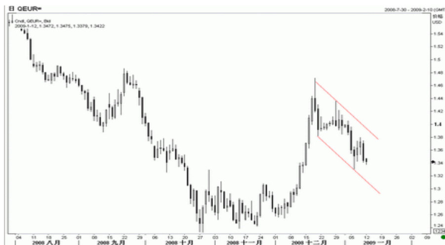
图3：欧元日K线图（截至北京时间09年1月12日）

欧洲央行行长特里谢 8 日表示 欧元区的经济状况已明显恶化，最近多数预测也是最为悲观的，从全球来看这都是真实的，并非仅有欧洲如此。特里谢的此番言论，刺激了有关欧洲央行将降息的预期，预计欧洲央行如果本周不降息，下次也会降，而且利率最终将降至 2% 下方。