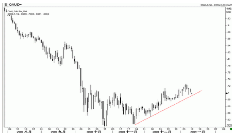
图6：澳元日K线图（截至北京09年1月12日）