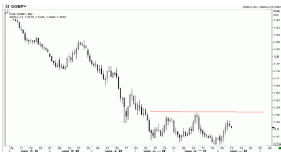
图4：英镑日K线图（截至北京09年1月12日）

英国央行上周降息 50 个 BP 至 1.5%，为英国央行成立以来的最低水平，也是 300 年来的最低利率。尽管如此，由于英镑此前的大幅下跌，已经比较充分的消化了各项利空因素，因此消息公布后英镑反应平淡。预计英国央行仍有继续降息的风险，英镑利率低至 1% 的可能性依然很大。