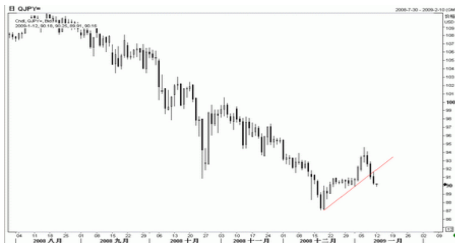
图5：美元/日元日K线图（截至北京09年1月12日）

日本方面，麻生太郎政府 12 月批准了总额达 88.548 万亿日圆的 09 财年预算计划，其规模创日本历史之最，在出口和投资因经济危机遭受打击的情况下，日本政府希望通过加大财政支出来提振经济，但由于日本内需一直不够景气，因此预计日本经济陷入衰退将难以避免。