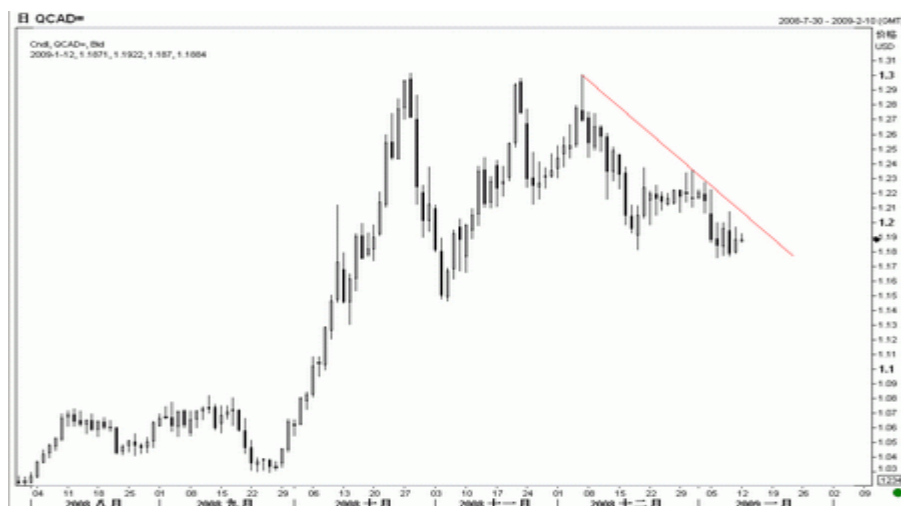
图7：美元/加元日K线图（截至美东09年1月12日）

美元/加元近期维持振荡走势，日线图上已经形成了一条下降通道，KD 指标仍在向下延伸，显示汇价有进一步的下行压力，但若突破该压力线，则有向 1.24 甚至更高价位上扬的需求。