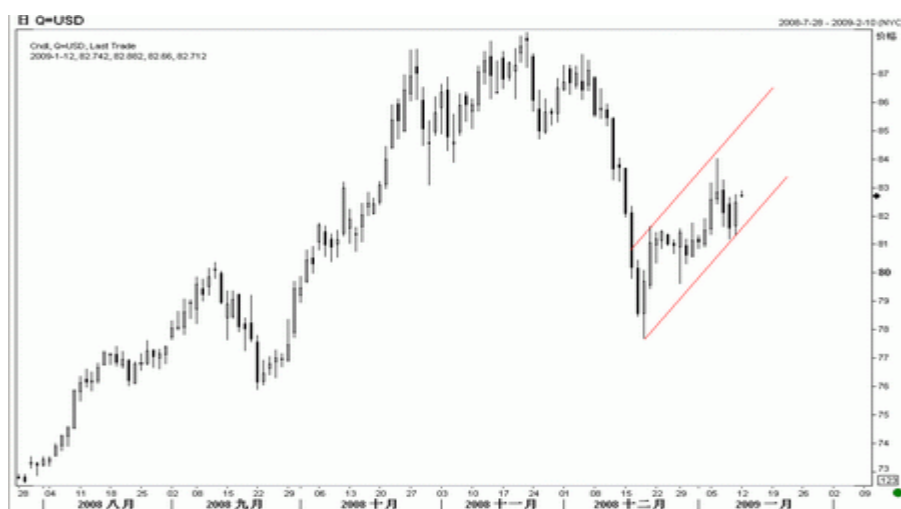
图1：美元指数日K线图（截至北京时间09年1月12日）

在其他数据方面，美国 11 月营建支出月降 0.6%，降幅小于预期；11 月份现房销售指数环比下降 4% 至 82.3，创下 2001 年开始编制该数据以来的最低水平；11 月工厂订单环比下降 4.6%，坏于预期；12 月 ISM 非制造业活动整体指数为 40.6，高于 11 月的 37.3。