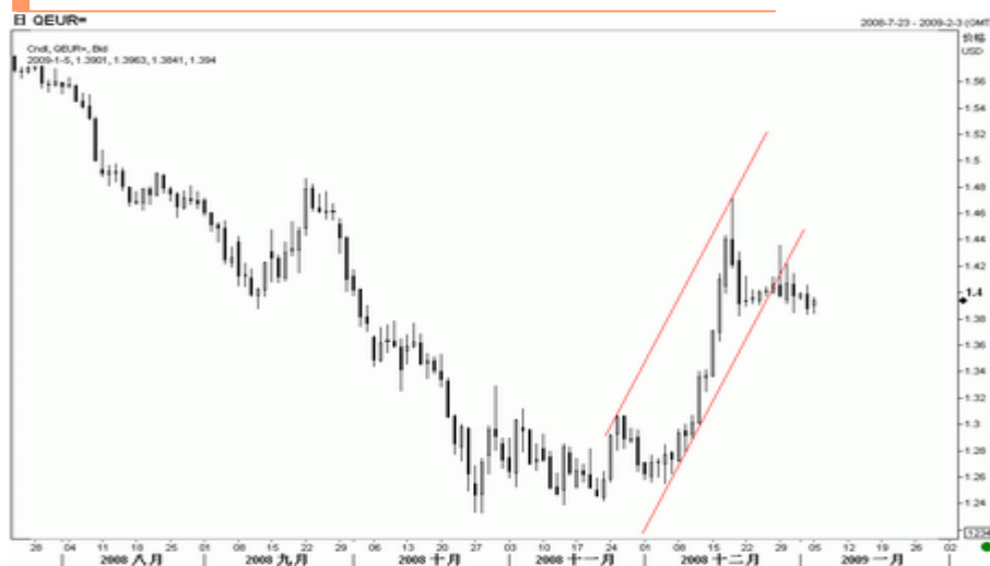
图3：欧元周K线图（截至北京时间09年1月5日）

从技术图表观察，欧元出现冲高回落走势，冲高 1.4350 后大幅下挫，周线收出长上影线的阴线，显示上方压力强劲，下行压力较大。日线图上，欧元 KD 指标出现高位死叉，也支持欧元下行，预计欧元有进一步跌向 1.36 一线的风险，若破位则可能进一步跌向 1.3300。