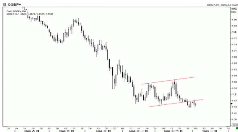
图4：英镑周K线图（截至北京09年1月5日）

英国房地产行业继续下滑，12月 Hometrack 房价指数环比下降 0.9%，同比下降 8.7%，不仅为连续第 15 个月下滑，而且同比降