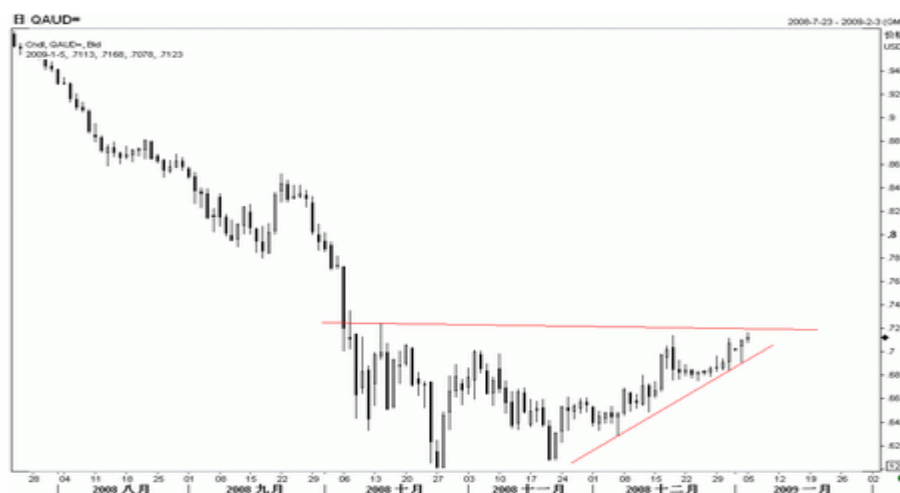
图6：澳元日K线图（截至北京09年1月5日）

澳元上周大部时间继续维持横盘整理，尾盘出现上扬。从盘面观察，澳元在突破7月份以来的下降压力线后相对持稳，短期进一步走强的信号得以延续，但从技术图表观察，目前澳元仍缺乏底部形态，自10月以来的振荡走势，演化为底部和下跌中继的概率相当，后市仍面临较大的不确定性。