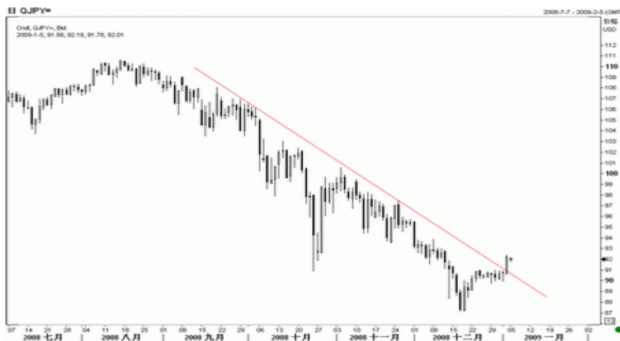
图5：美元/日元日K线图（截至北京09年1月5日）