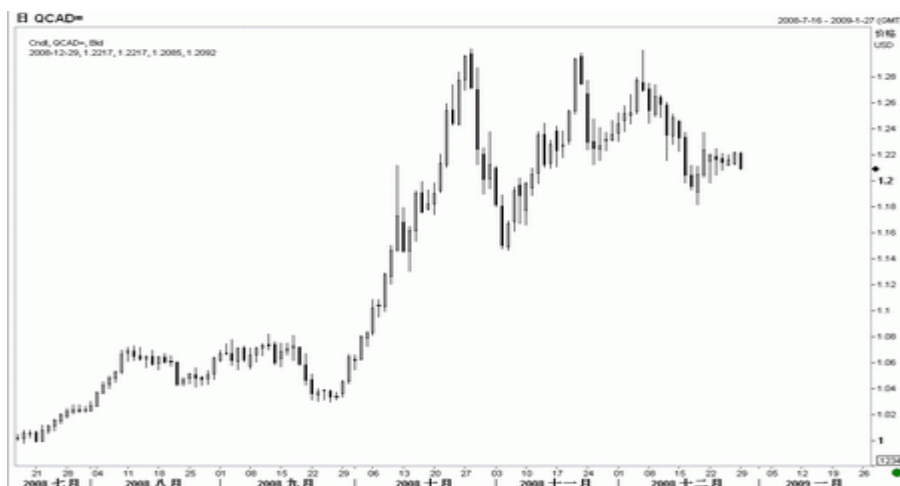
图7：美元/加元日K线图（截至美东09年1月5日）