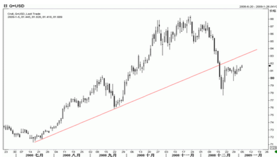
图1：美元指数日K线图（截至北京时间09年1月5日）

美元指数近期维持振荡并略有上扬，日线图上似形成一小型三角形，后市上攻的可能性较大，但 83 一线存在较强阻力，为此前已经跌破的上升趋势线，在这里走势遇挫的可能性较大，后市倾向冲高回落。