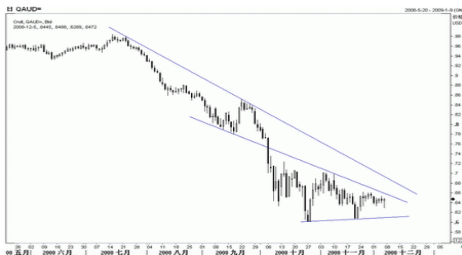
图7：澳元日K线图（截至北京08年12月5日）

澳洲联储上周宣布，下调基准利率 100 个 BP，至 4.25%，降幅超出预期，澳元利率降至 6 年半以来的最低水平，从澳洲宏观经济来看，未来仍有进一步降息的空间。