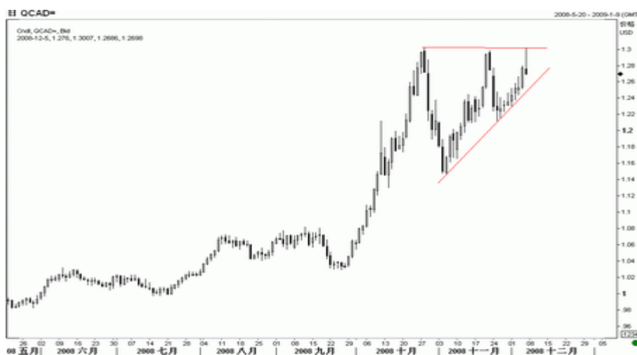
图8：美元/加元日K线图（截至美东08年12月5日）

美元/加元上周振荡上扬，再次触及 1.3 关口不过后大幅回落，短期表现出一定的下行压力，但天图上依然呈现整理三角形的形态，预示后市仍有上冲潜力，且缺乏看空美元/加元的技术支持，因此仍维持看涨不变，但若再次跌回 1.21，则美元/加元上行动能可能会受损。