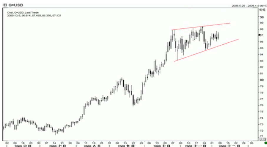
图2：美元指数日K线图（截至北京时间08年12月5日）

将引发短期下行压力，届时将有跌向 83.10 的风险。只要不跌破 83.10，倾向于认为技术上就不会形成头部，跌破 83.10，则视为构筑头部，展开更大幅度的调整。