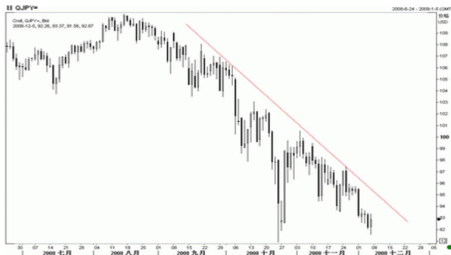
图6：美元/日元日K线图（截至北京08年12月5日）

日本近期公布的数据依然糟糕，11月汽车销量同比大跌 27.3%，为连续第4个月下滑；三季度企业资本支出年比下降13%， 同期企业税前盈利年比下降22.5%，显示日本经济处于低迷中。