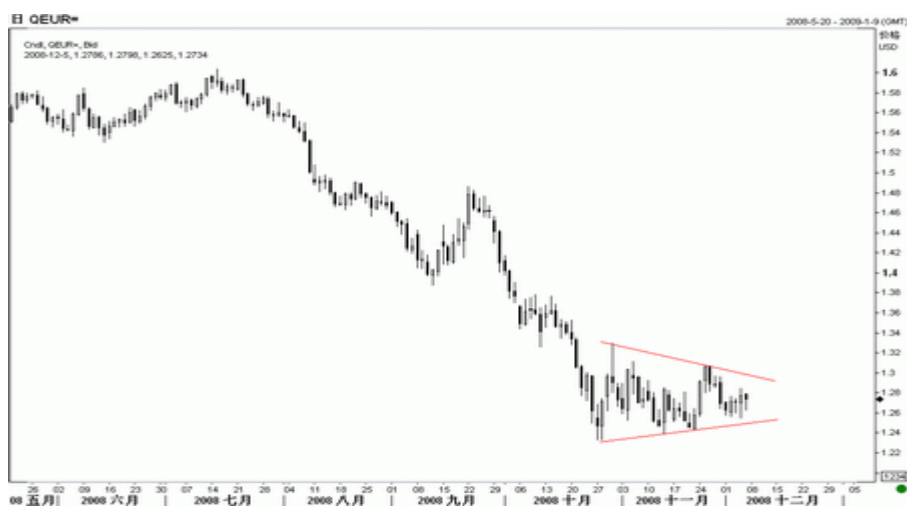
图4：欧元日K线图（截至北京时间08年12月5日）

欧元上周维持振荡走势，并略有上扬，短期方向似有反弹空间，但技术上欧元并未出现破位，10 下旬开始的整理三角形形态依然有效，仍视为下跌中继，后市继续维持看空。中期角度而言，只要欧元不升破 1.34，则中期均可维持看跌。