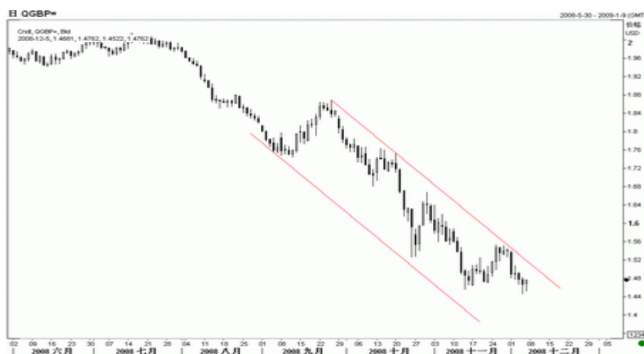
图5：英镑日K线图（截至北京08年12月5日）

看，英镑自9月开始的下跌通道仍维持稳固，预计近期英镑仍将在 此区间内运行，只有突破该区间上轨压力 1.5300，才有进一步向上 反弹的机会，因此目前仍维持看空英镑不变。