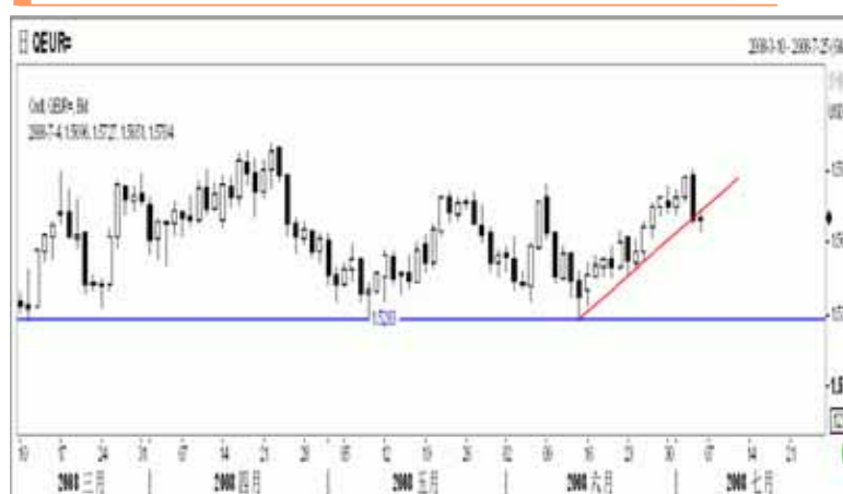
图3：欧元日K线图（截至美东08年7月4日）

欧元上周冲高后大幅回落，周 K 线收出带上影线的阴线，而且这是在 1.58-1.60 这个敏感区间第四次遇阻回落，这为欧元后市蒙上了阴影。