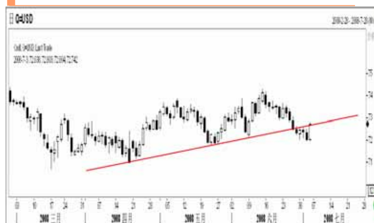
图1：美指日K线图（截至美东08年7月4日）

从技术上看，美元指数上周连续两次在72.0关口附近寻获支撑，周五美指的强劲反弹使其构筑了一个小型双底，而且美指收盘已经重新站上了前期上升通道的下轨，表明美元有机会结束6月中旬以来的这波跌势，并使得自3月份开始的中期反弹使得得以延续。