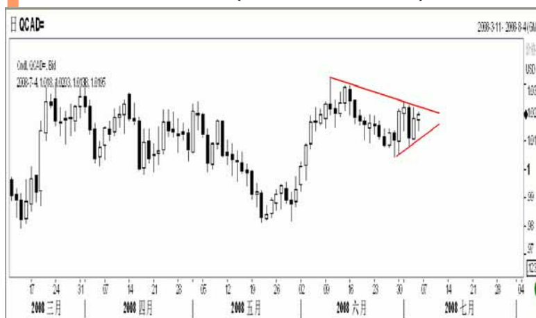
图7：美元/加元日K线图（截至美东08年7月4日）

美元/加元上周陷于区间振荡，短线方向不明，日图 KD 指标维持死叉向下，周图 KD 指标亦出现死叉，汇价的下行压力略占上风。上周汇价运行出整理三角形，本周面临短线突破，下破则有跌向 0.9860 的风险，上破则会测试振荡区间上轨压力 1.0330。