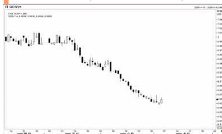
图2：人民币日K线图（截至北京时间08年7月4日）

随着美元反弹势头日益明显，以及国内加息预期日渐升温，人民币兑美元的涨势可能将逐渐放慢。