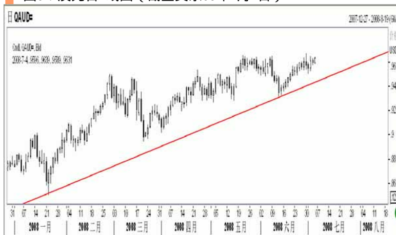
图6：澳元日K线图（截至美东08年7月4日）

显受到欧洲货币下跌的影响。不过从周K线图来看，澳元收出长下影线的小星线，显示上方存在较强的阻力，本周继续冲高有一定难度，预计 1.97 一线有较强阻力，澳元本周可能出现冲高回落走势。