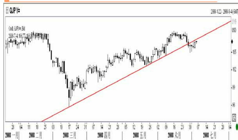
图5：美元/日元日K线图（截至美东08年7月4日）

美元/日元上周小幅反弹，从技术来看恰好在对前期的上升趋势线进行回抽，日图KD指标死叉向下，支持美元/日元走低，预计本周初在完成回抽后，美元/日元可能会再次下行，下试104.50的支撑，并有下破风险。